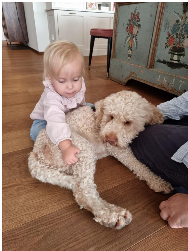
Mathilda übt Kontakt mit Lilien

Bemerkenswert war auch, dass Mathilda zu Beginn sehr viel Groll hatte und dies auch an Lilien, durch Treten oder Zwicken zum Ausdruck brachte. Mit der Zeit wurde dieser Groll allerdings viel weniger bis gar nicht mehr.