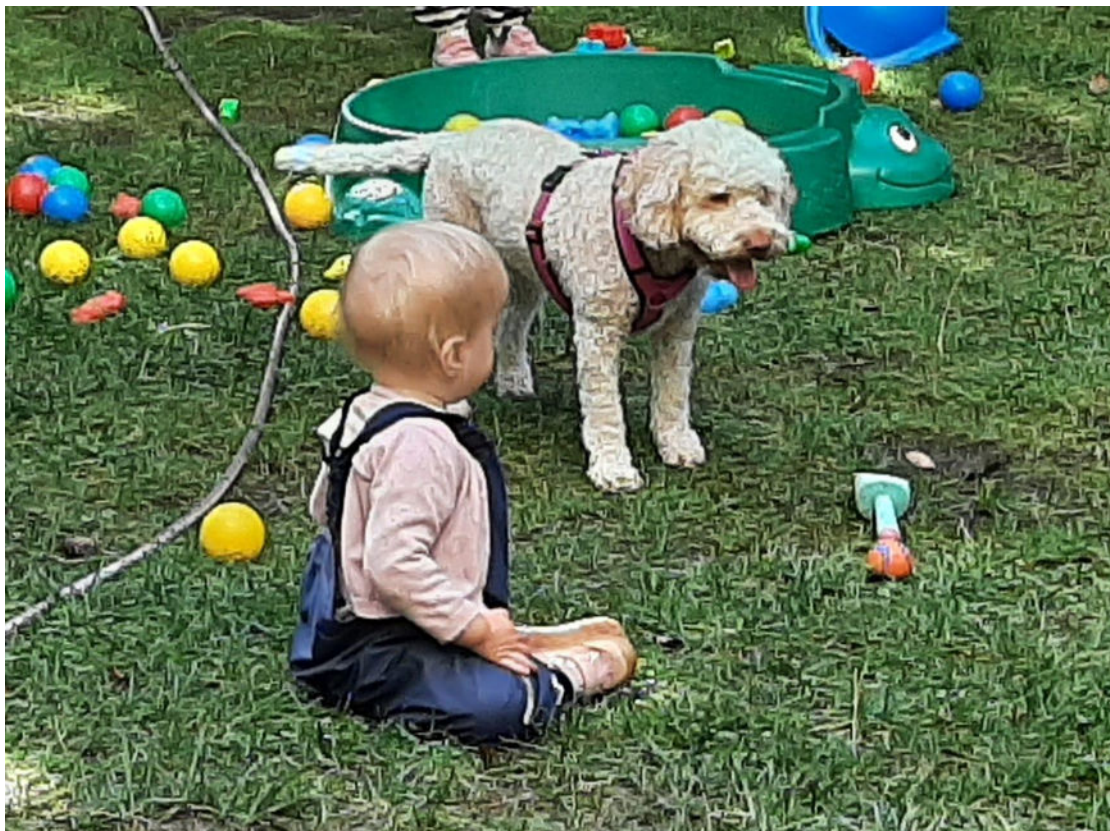
Lilien im Einsatz in der Kindergruppe Unterm Kirschbaum