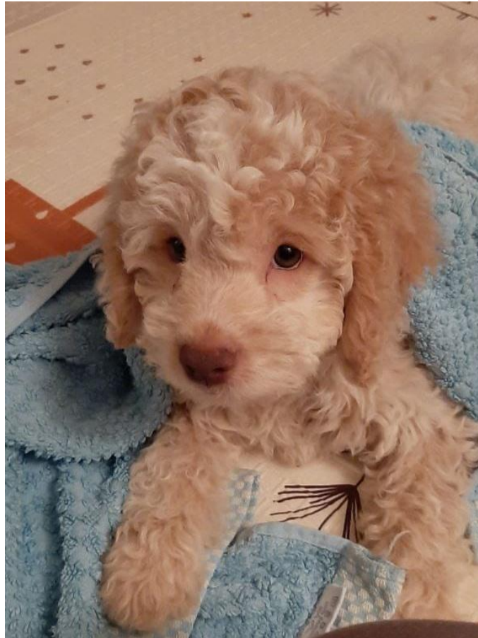
Darf ich vorstellen: Lilien

Es war im Jahr 2022, als eine Lagottohündin das Licht der Welt erblickte.